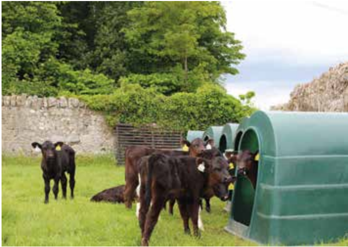
Die Kälber kommen schon früh in Kleingruppen auf die Weide, um frühzeitig das Gras zu lernen.