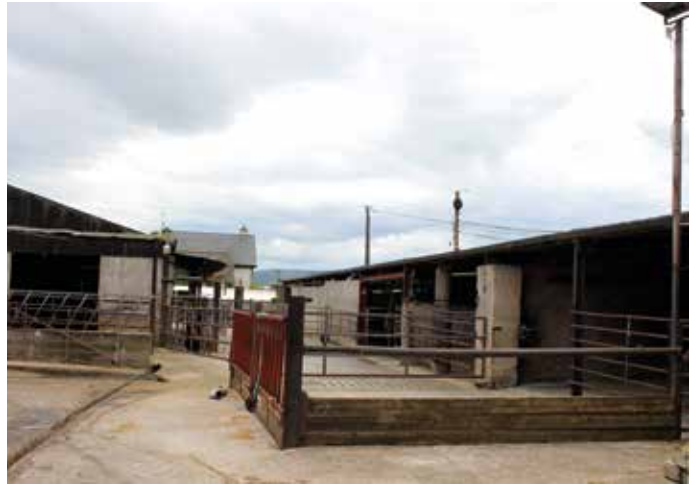
Die Stallgebäude sind schlicht und funktional. Sie werden nur in der kurzen, knapp dreimonatigen Periode im Winter benötigt. Ausnahme ist natürlich der Melkstand.