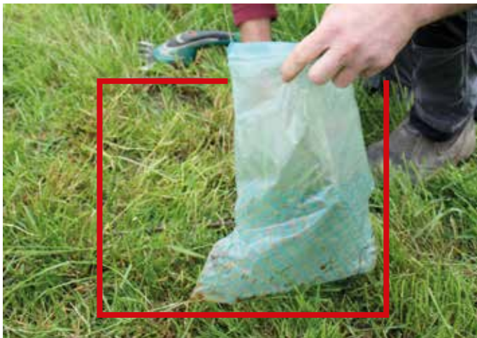
Bis zum idealen Weiderest von 4 cm schneidet Pat das Gras ab in dem vorgegebenen Quadrat. Mit einer einfachen Federwaage und einer App bestimmt er den Trockenmassegehalt pro Hektar Weidefläche auf dem Paddock.