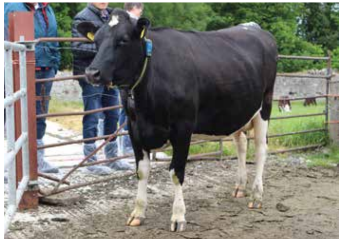
Der irische Typ der Holstein-Friesian ist mittelrahmig, kompakt mit einem hohen Rippenansatz, damit sie die großen Grasmengen aufnehmen können. Die Klauen sind von Natur aus sehr gut.